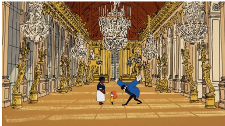
Image tirée du film La Vie de château, mon enfance à Versailles