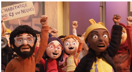
Image tirée du film Olivia et le tremblement de terre invisible