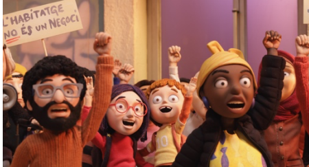
Image tirée du film Olivia et le tremblement de terre invisible