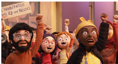
Image tirée du film Olivia et le tremblement de terre invisible