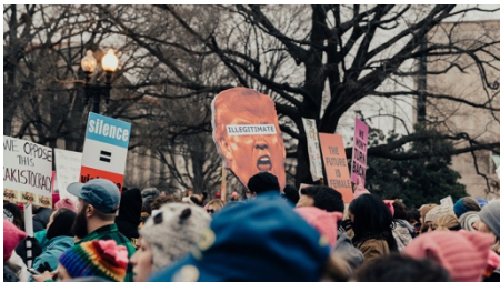
Image d'une manifestation anti-Donald Trump