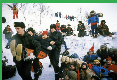
CONFLIT D'ALTA EN 1978