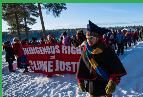
FRIDAY FOR FUTURE, MANIFESTATION EN 2020