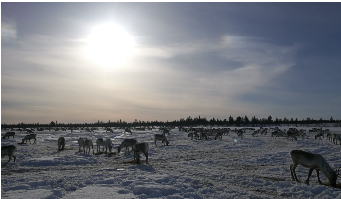
DES RENNES DANS L'ARCTIQUE FINLANDAIS

Dans cette région transnationale, le peuple autochtone Sámi assiste à la dégradation progressive des ressources naturelles de cet espace par les industries notamment forestières qui, combinée au réchauffement climatique, nuit à la biodiversité et au mode de vie traditionnel local.