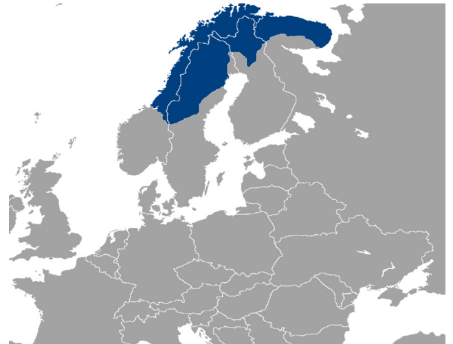
CARTE DES TERRITOIRES SÁMIS

En utilisant le yoik comme moyen de communication artistique, le film devient un vecteur puissant pour sensibiliser le public à la richesse de la culture Sámi. Il devient également une plateforme pour transmettre un message urgent aux générations futures sur la nécessité de préserver ces valeurs culturelles et de protéger l'environnement. .